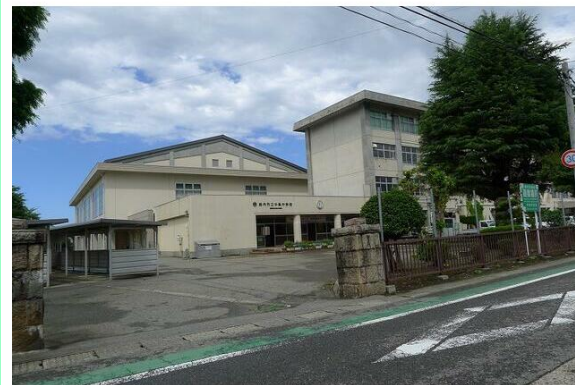
胎内市立中条中学校