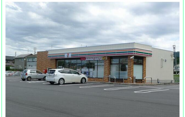
セブンイレブン胎内新和店

※この図面はATBBの物件情報の一部を抜粋して掲載しております。(現況優先) ※入居日・引渡日変更や付帯条件、別途料金が発生する場合がありますのでご確認ください。