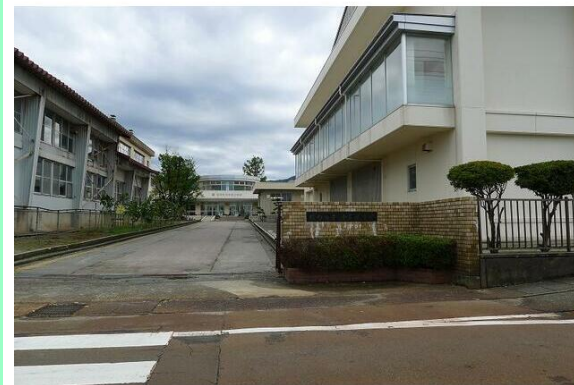
胎内市立中条小学校