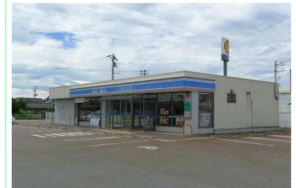
ローソン胎内西本町店

※この図面はATBBの物件情報の一部を抜粋して掲載しております。(現況優先) ※入居日・引渡日変更や付帯条件、別途料金が発生する場合がありますのでご確認ください。