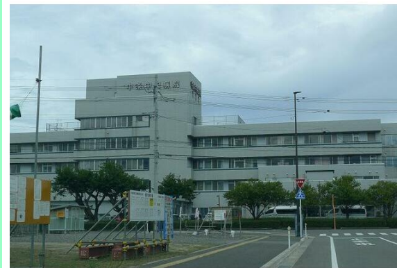
共生会中条中央病院